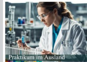
Praktikum im Ausland

Ein Auslandsstudium empfiehlt sich insbesondere zu Mitte oder Ende des Studiums.