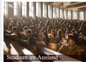
Studium im Ausland

Alles Wichtige zu Bewerbung, Finanzierung und Ablauf finden Sie unten in den jeweiligen Tabs.