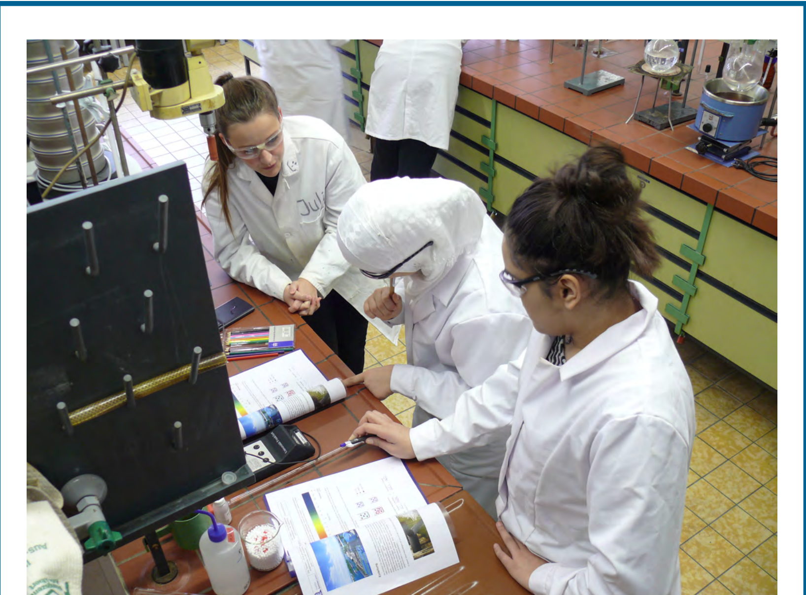
Abb: Eine Studentin (links) experimentiert mit zwei Schülerinnen der Erich Kästner-Schule im Ausbildungslabor der InfraServ

In der Praxisphase haben die Studierenden die Möglichkeit ihre didaktischen und methodischen Überlegungen durch die Arbeit mit einer Schülergruppe der Erich Kästner-Realschule in einem realen Ausbildungslabor für ChemielaborantInnen der InfraServ in Wiesbaden einem Praxistest zu unterziehen. Die SuS des WPU-Kurses der 9. Klasse kommen im Rahmen der Kooperation zwischen InfraServ und Erich Kästner-Schule ein Schuljahr lang an einem Nachmittag pro Woche auf das Gelände der InfraServ und werden hier von AusbildungsleiterInnen an chemische und technische Ausbildungsberufe herangeführt. Einen Nachmittag innerhalb dieses Programms übernehmen nun die Studierenden, indem sie mit den SuS die ausgearbeiteten Experimentierstationen und Materialien erarbeiten .