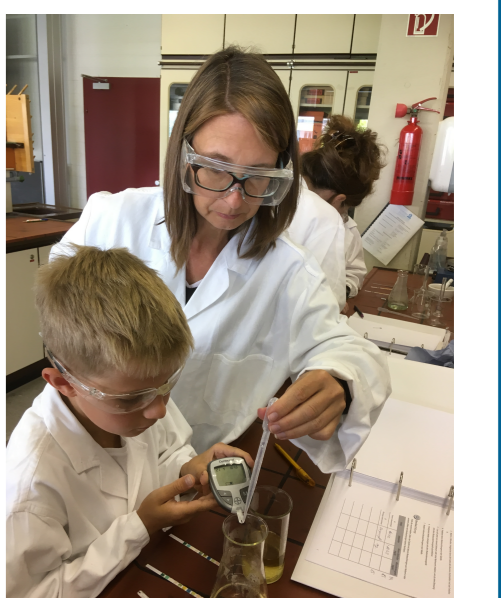
Abb. 1: Eltern-Kind-Team in Aktion

* Die Zahlen basieren auf Schätzungen. Dabei steht die Anzahl für Eltern-Kind-Paare. ** Die ausschließlich quantitativen Daten der Kontrollgruppe werden in einem Schuljahr an Grund- und Gesamtschulen erhoben.